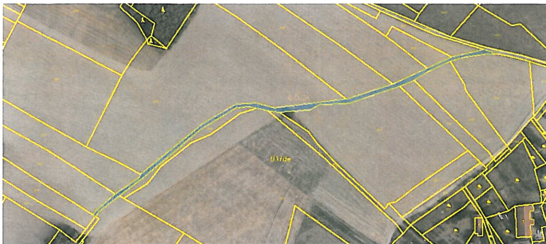
k.ú. Úsuší parc.č. 43/42